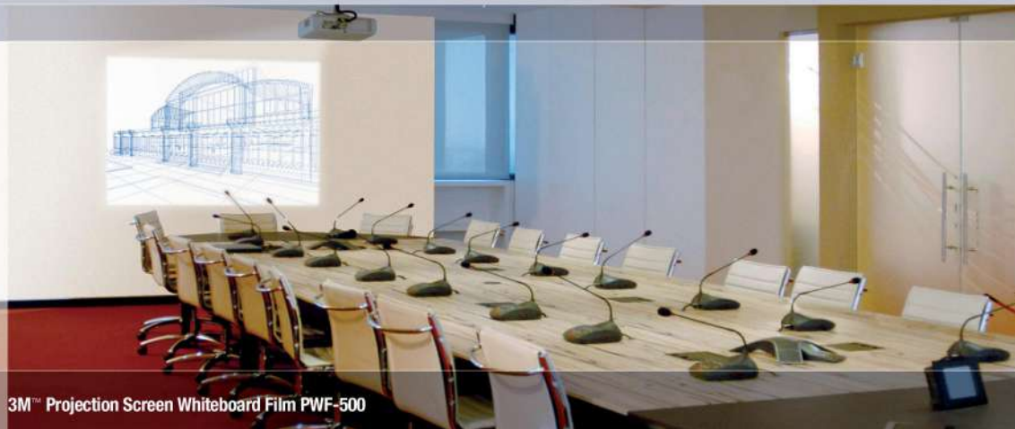
3M™ Projection Screen Whiteboard Film PWF-500