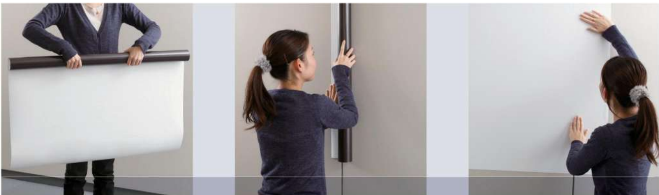
3M™ Projection Screen Whiteboard Film PWF-500MG