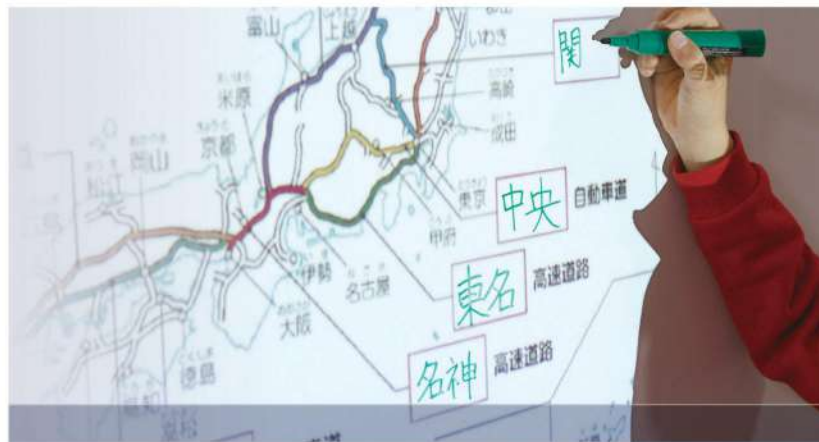
3M™ Projection Screen Whiteboard Film PWF-500

Die ideale Lösung für den mobilen Einsatz in Schulen, Kindergärten sowie Büro- und Meetingräumen.