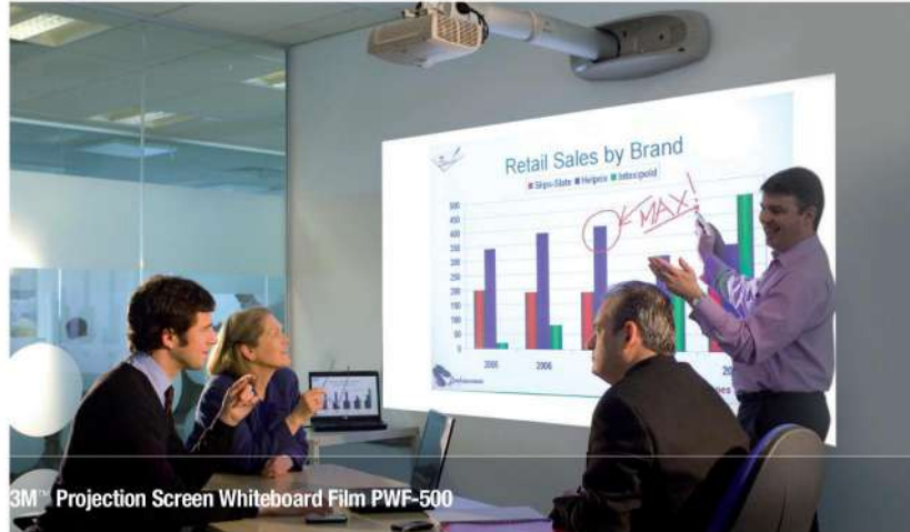
3M™ Projection Screen Whiteboard Film PWF-500

Die Serie PWF-500 ist mit der patentierten 3M™Comply™ Klebstofftechnologie 1 ausgestattet und lässt sich einfach und blasenfrei verkleben.